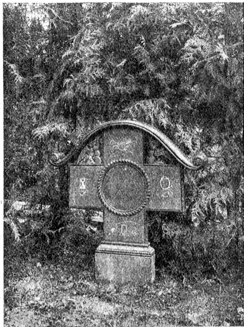
Grabzeichen aus Holz (bemalt). Entwurf von H. Schar, Ringgenberg.

Wunder an, man brachte das Ideal in die Heimat zurück, die Ruhestätten der von uns Geschiedenen ebenfalls mit