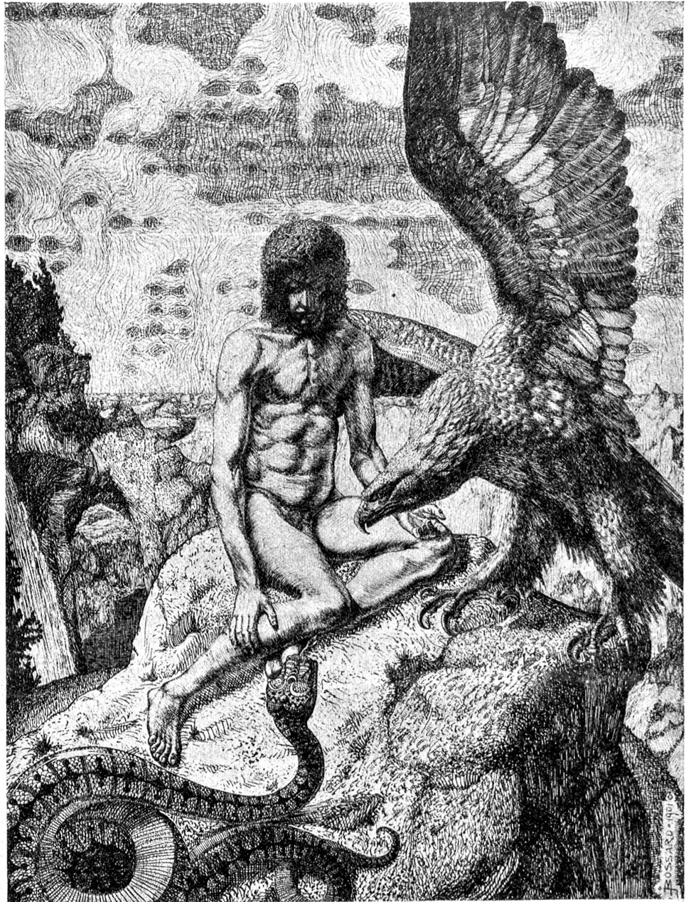
prof. Johann Bossard, Zug-hamburg, Adler und Schlange. Blatt IX aus dem Zyklus „Die Tragödie des Dafsels“. (Siehe Text auf Seite 4.)

und ein paar scharfe, zusammengekniifene Neuglein, die bald bemerkt haben, wo was zu holen ist. Geschuftet hat er seither, das ist wahr, und mit dem Milchführen nach der Stadt verdient er ein Heidengeld, das mag wohl sein, aber es gibt denn doch noch bessere Leute, um die 20,000 Franken zu heiraten, als gerade dieser Zugewanderte, von dem kein Mensch weiß, was er vorher gewesen ist. Der Milch-Saaler tut, als sei er taub und blind, und kommt jeden Abend zu Wagners. Die Mutter hat ihn gar nicht ungern. „Er ist so ein Fleißiger,“ meint sie, denn gleich am ersten Abend hat er gesagt: „Ich komme, um ein wenig zu schwätzen. Aber dabei können wir auch etwas tun. Ich kann nie ohne Arbeit sein. Luise mag weiter-spinnen, ich will haspeln.“ So geschieht es, und wenn ein brotneidiger Vorderwiler durch die Fensterscheiben guckt, dann sieht er die Luise spinnen und den Milch-Saaler haspeln. Drum dichten sie den Spottvers. Aber das bringt die zwei nur noch mehr zusammen, und die Vorderwiler können nichts dagegen machen. Bloß daß sie bei der Hochzeit nicht schießen. Aber der Milch-Saaler sagt: Das sei ihm recht. Dann brauche er sich nicht zu bedanken, und es koste ihn kein Trinkgeld, und überhaupt habe er das laute Klöpfen nicht gern, es tue nur weh in den Ohren.