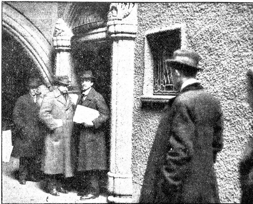
Die internationale Sozialistenkonferenz in Bern: Branting.

In der Tat, wo war die Gelegenheit günstiger, die Träger der Geschichte unserer Tage persönlich kennen zu lernen, als hier? Sah man doch unter der deutschen Delegation Männer wie Kurt Eisner, der sich rühmen darf, in acht Stunden mit seiner Revolution zusammengestürzt zu haben, was die Hohenzollern in acht Jahrhunderten an ihrem Machtgebäude aufgebaut. Der Thronertrümmerer und heutige bayrische Ministerpräsident ist ein mittelgroßer, nichts weniger als martialisch und regentenhaft aussehender