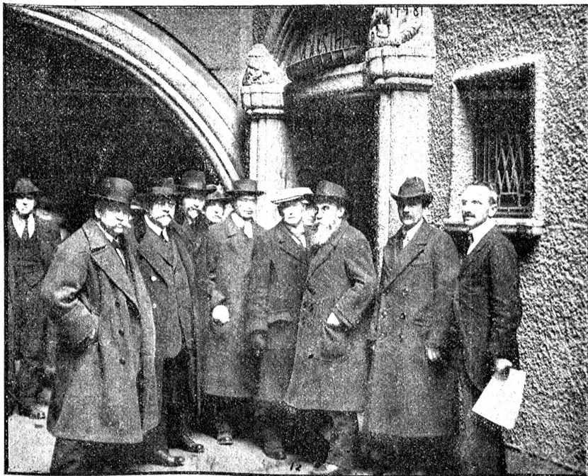
Die internationale Sozialistenkonferenz in Bern: Kurt Eisner.