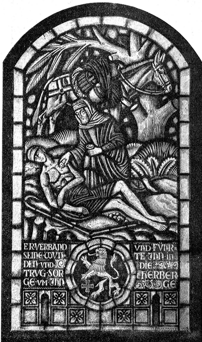
Der barmherzige Samariter, Glasgemälde in der Kirche zu Lahr (Westertal). Entworfen von Albin Schwerl, Ramsen (Schaffhausen). Ausgeführt durch Albert Zentner, Glasmaler in Wiesbaden.

„Du mußt nur recht probieren. Faß an einem Zipfel an. Vielleicht ist es auch gar nichts Schlimmes.“