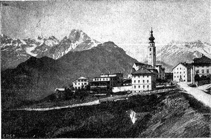
Im Unterengadin: Fetan, das Hochterassendorf.

fröhlich knallen, Junge. Bind deine Schürze besser um, Mädchen, sonst verlierst du sie beim ersten Zug. Nimm die andere Gabel, du, nicht daß dir die eine Zinke gleich abbricht, sie ist gar schwach und du lädst gar schwer. Gib sie dem Knechtlein, für den ist sie gerade recht. Da sind wir, marsch, herunter vom Wagen. Jetzt muß es laufen."