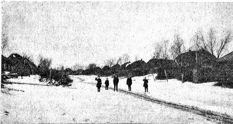
Hauptstrasse von Jassnaja Poljana.

sein mag, es ist durch dies Ereignis allein entschieden, daß er im Tiefsten Nichtkünstler, Kunstfeind von Anfang an sein mußte, und daß all sein Denken und Trachten in der Kunst nur Vorstufe, unreine Vor-Offenbarung des eigentlichen Tolstoi war.