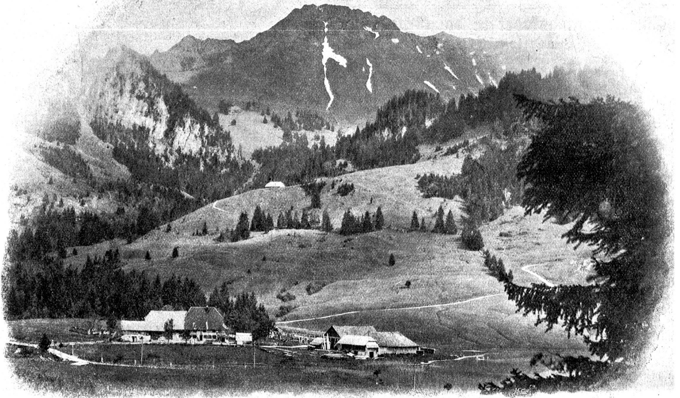
Die Gipsera am untern Ende des Schwarzsees./

fiel, sahen wir einander an — und lachten! Und ich hinkte nicht mehr, und alle Müdigkeit schien verschwunden! Auf dem andern Ufer der Savroz ließen wir uns am Wege nieder und verzehrten wohlgenut das karge Abendbrot. Mir aber war's sonderbar leicht ums Herz, und ich sang so laut, daß es die Karthäuser in allen Zellen und Kapellen hören mußten — dann nahmen wir ein weiteres Stück Weg unter die Füße und zogen nach Charmey. Die Betglocken von Cerniat und Crésuz drüben an der Berglehne tönten melodisch in den hellen Frühlingsabend!