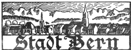
† Jakob Tschirren,

Wegen angeblich vorgekommener Unregelmäßigkeiten in der Abstimmung über das Bundesgesetz betreffend die Ordnung des Arbeitsverhältnisses in den Fabriken sah sich der bernische Regierungsrat veranlaßt, eine Nachprüfung der Abstimmungsergebnisse in sämtlichen bernischen Gemeinden anzuordnen. —