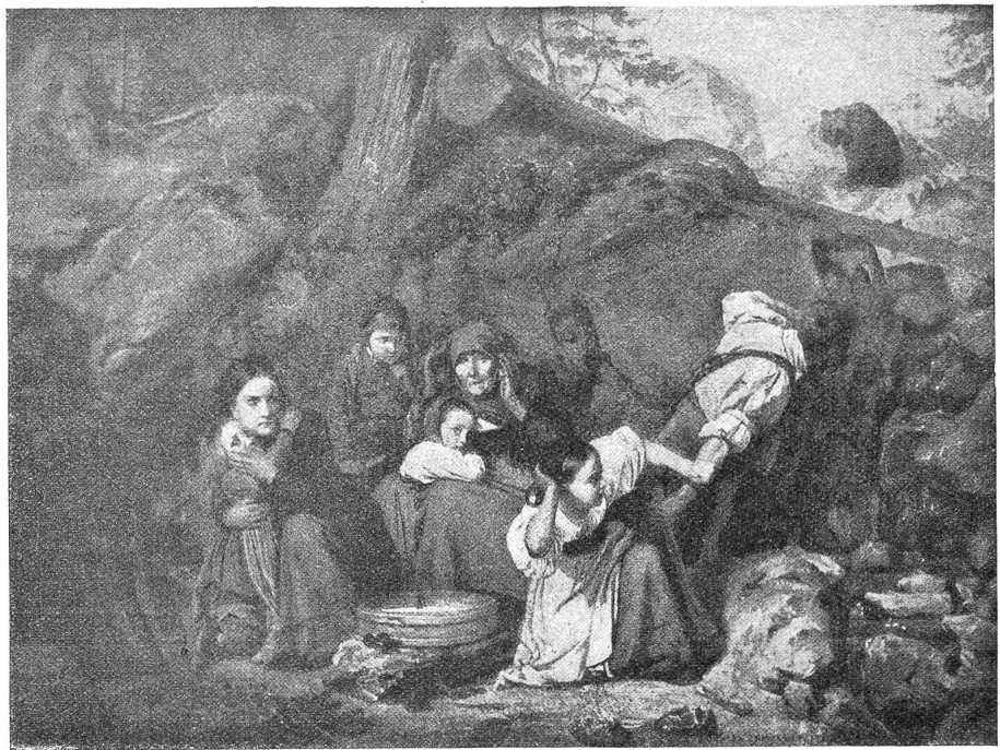
Eduard Girardet (1819—1880).

Die Zeit, in der Girardet malte, liebte das figurenreiche, erzählende Genrebild. Man wollte damals noch eine Handlung oder eine Situation dargestellt sehen, am liebsten eine, die auf das Gemüt wirkte. Solche Szenenbilder waren im Grunde nichts anderes als Illustrationen zu einer Erzählung, aus der sie den „Fruchtbaren Moment“ herausgriffen und verbildlichten. So entstanden die dramatisch bewegten Bilder „Mutterliebe“ und „Die unterbrochene Mahlzeit“ (im Neuenburger Museum). Beide lassen an dramatischer Spannung in der Situation nichts zu wünschen übrig.