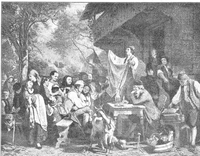
Eduard Girardet (1819—1880).

Eine friedlichere Szene zeigt das untenstehende, letzte hier reproduzierte Bild, das, wiederum dem realistischen Zeitgeschmack entsprechend, eine ländliche Gantsteigerung dar-