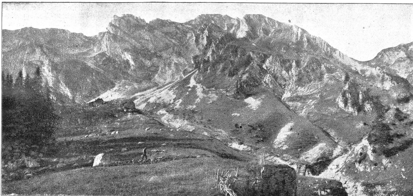
Das Einzugsgebiet der Blattenheidquellen.

An diese Trinkwasseranlage ist ein kleines Kraftwerk angeschlossen, das das Gefälle der Leitung von zirka 600 Metern bei Blumenstein ausnützt. Die heutige Technik ermöglicht eine solche Ausnützung, ohne daß dadurch die Qualität des Wassers, das also auch zuerst durch Turbinen strömt, ehe es in die Verteilungsleitung gelangt, herabgelekt würde. (Vergl. Abb. auf S. 236.)