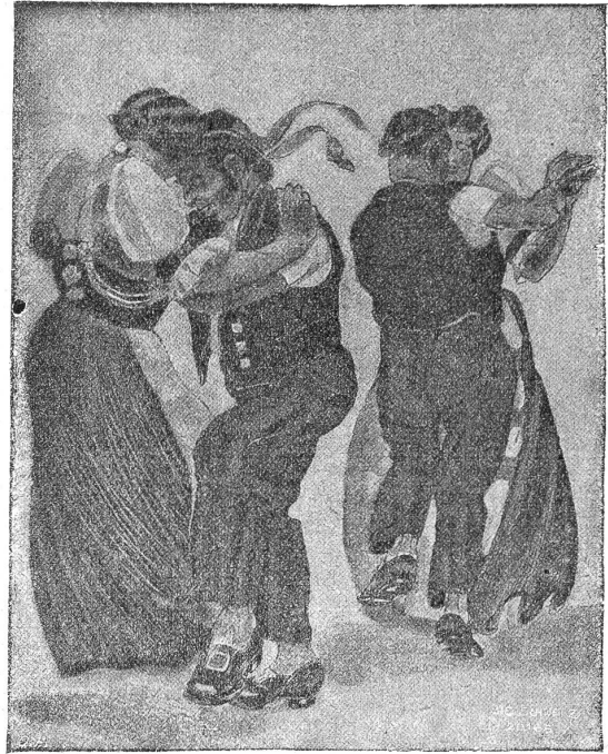
Sebastian Oesch. Canzende Bauern (Sriesfragment).

streckt dem hungrigen Muß eine tolle Gablete Heu in den Barrenladen, so daß unser Fakitus wohl oder übel dreinbeißen muß. Das gab natürlich ein Huronengeheul bei der ganzen Bande! —