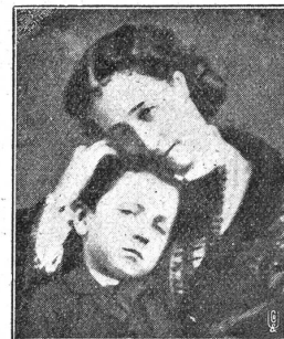
Kaiserin Eugenie mit dem Prinzen „Loulou“.

Nun kam das Schicksal mit raschen und schweren Schlägen über die schöne Frau. Am 2. September kapitulierte Sedan, am 3. wurde ihr Gatte als Gefangener auf Schloß Wilhelmshöhe abgeführt. Am 4. September erfuhr Paris den Zusammenbruch und sogleich erhob sich das Geschrei: „Absetzung! Republik!“ Im Stadthaus proklamierte Gambetta die Thronentsetzung der Napoleonischen Familie auf ewige Zeiten. Um 1 Uhr nachmittags verließ die Kaiserin die Tuileries, um nie wieder dorthin zurückzukehren. Sie