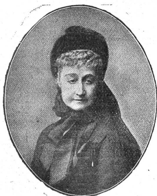
Eugenie von Montijo

Der Tod der Ex-Kaiserin weckt die Erinnerung an die Beziehungen, die Eugenie durch ihr Schloß am Untersee mit der Schweiz pflegte. Bekanntlich hat die Mutter Louis Napoleons, die Frau Gemahlin Louis Napoleons, einst König von Holland durch seines Bruders Gnade, vor den Metternichschen Verfolgungen im Kanton Thurgau Zuflucht gefunden. Königin Hortense weilte Ende 1816 und anfangs 1817 in Konstanz als Gast der Großherzogin von Baden, einer ihrer Verwandten. Doch war hier ihr Bleiben nicht, sie sollte auf Befehl der Mächte Baden verlassen. Da nahm sich die thurgauische Regierung der gehezten Königin an und bot ihr den Aufenthalt auf thurgauischem Boden an. Von der Konstanzer Familie v. Streng erstand sich dann Hortense das Landhaus Arenenberg bei Ermatingen und bezog es mit ihrem damals 10jährigen Sohne Louis. Sie verblieb hier trotz des Einspruchs der Mächte; denn die Thurgauer blieben standhaft. Das Landhaus wurde nun von Grund aus umgebaut und bekam so sein heutiges