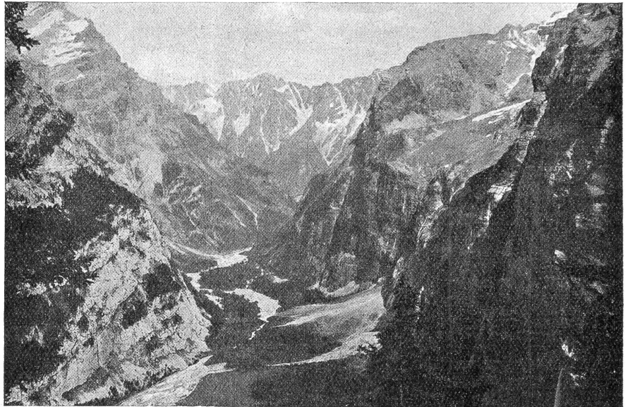
Das Gasterntal vom Gemmipass aus.

Wir sehen die Gemeinwesen im harten Existenzkampf alle möglichen Wege einschlagen. Baselstadt verpflichtet die Kantonalbank, einen Teil ihres Reingewinnes an die Staatskasse abzuliefern. Glarus führt neue Erwerbssteuern ein. Die Stadt Chur belastet ihre Steuerzahler neuerdings und hat eine von den Sozialdemokraten eingereichte, von 200 Unterschriften bedeckte Initiative auf Einführung der reinen Einkommensteuer zu behandeln. Die Gemeinde Glarus er-