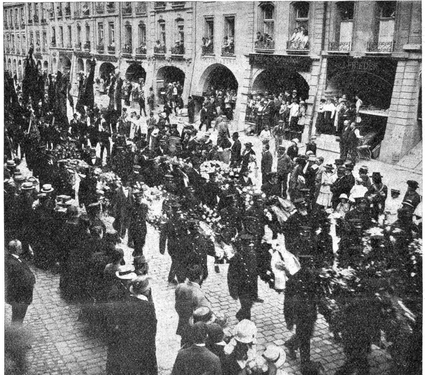
Vom Leichenbegängnis für den am 26. Juli verstorbenen Nationalrat und Eisenbahner-Generalsekretär Emil Düby.

Die Vorschüsse konnten auf Begehren des Finanzdepartements in Beträgen von mindestens Fr. 100,000 bis Ende Februar 1921 bei der Kantonalbank er-