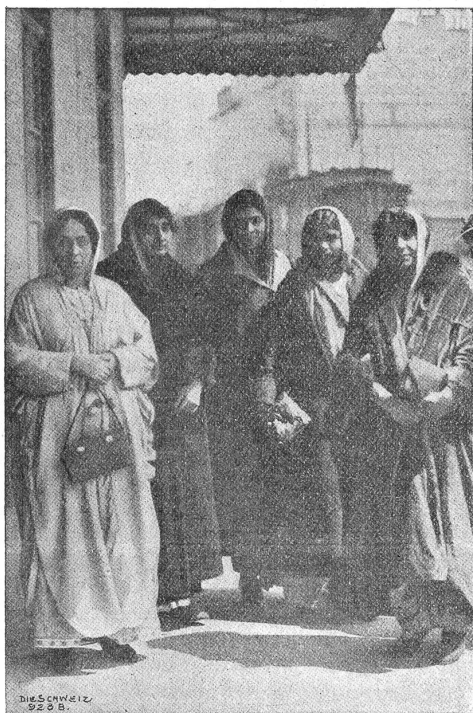
Der Internationale Frauenkongress in Genf.

*) Unseren Ausführungen liegt die 1920 im Kommissionsverlag Benno & Schwabe, Basel, erschienene Broschüre „Weibliche Berufsberatung“, Bericht über den II. Instruktionkurs für Berufsberatung am 10. und 11. Oktober 1919 in Basel, herausgegeben vom Schweiz. Verband für Berufsberatung und Lehrlingsfürsorge, zugrunde. Wir möchten das inhaltsreiche Buch allen Eltern und Erziehern warm empfehlen.