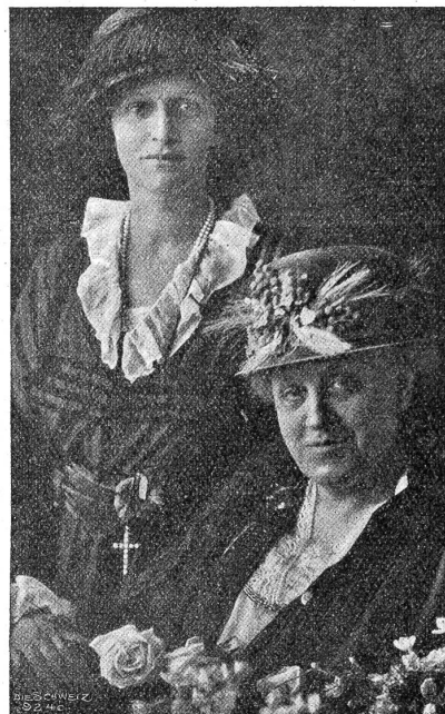
Der Internationale Frauenkongress in Genf.

Mehr denn je wird ein Vater und wird die Mutter sich fragen müssen, wie statte ich meine Tochter aus, daß sie den Weg durchs Leben nötigenfalls selber findet. Denn die