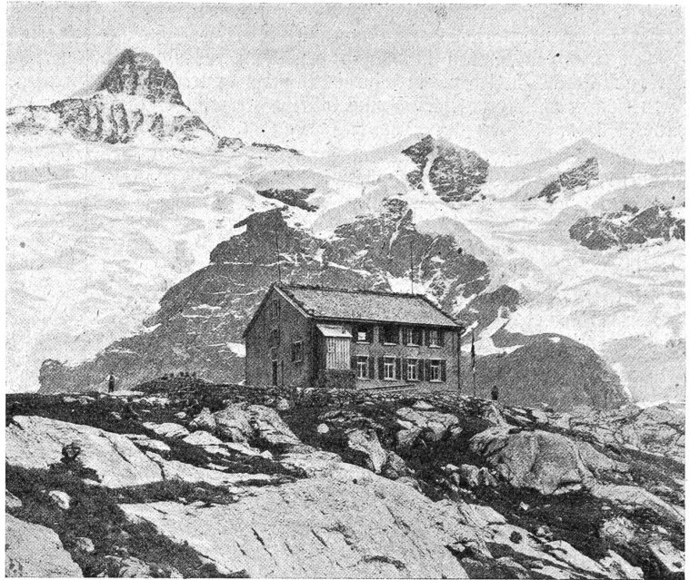
Die neue Gledsteinhütte.

Im Hintergrund der obere Grindelwaldgletscher (links) und der Wechselgletscher (rechts), das Schreckhorn (links), Gwächten (Mitte) und Mettenberg (rechts).