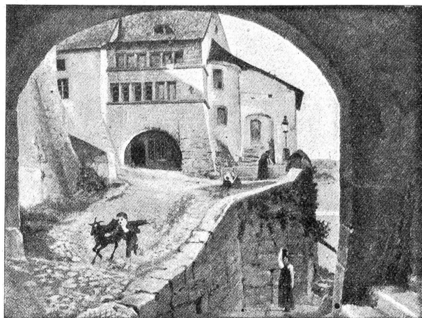
Blick durch das Rathhaustor nordwärts in die Altstadt. Nach einem Gemälde von Paul Robert aus dem Jahre 1873.