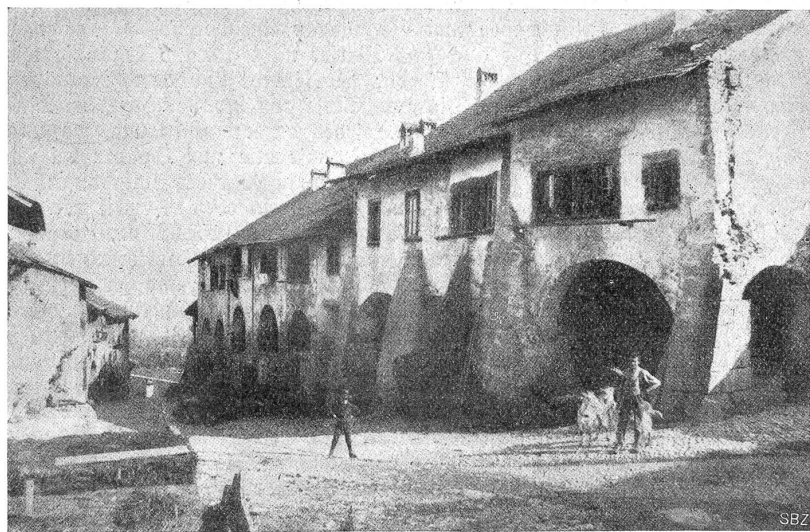
Das Städtchen Erlach am Bielersee vor dem Brande vom 17/18. August 1915.

Dörfern besteht, und sahen hinunter ins breite Rhonetal. Köbi wollte einige hübsche Saviésanerinnen abknipsen, aber uha —, die stoben auseinander wie eine Schar aufgeschreckter Hühner und verschwanden in den schönen braunen Hütten. Und es bedurfte aller meiner Redekünste, um sie wieder herzuloden. Aber es gelang mir doch, und am Ende waren sie noch recht zutraulich. „Mais il ne faut pas nous montrer dans tous les coins de la rue“, meinten sie dann, als Köbi sie einige Male photographiert hatte. — Es machte nun sehr heiß und so versuchten wir in einem kleinen Weizli den vin du pays. Er ist ganz süffig, aber er steigt leicht nach dem Oberstübli, da wir aber Maß hielten, machte er uns nichts, und wir stiegen ganz süßerli über die holperigen Wege durch die Rebberge hinab nach der Kantons-hauptstadt. Reizend sind die schloßgekrönten Hügel von Valère und Tourbillon, die mitten aus dem Talboden herauswachsen. Und auch das Städtchen um diese Schlösser