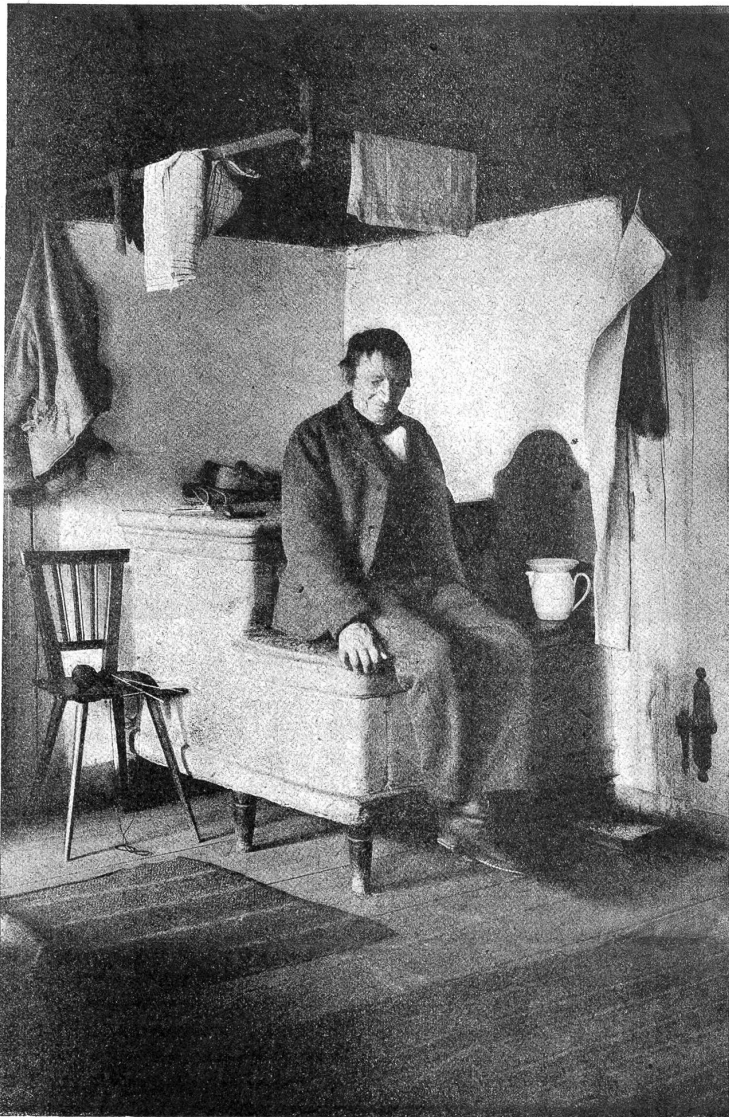
Ein warmer Ofen ist doch heimlich.

Der Meister denkt: „Der Melcher Ist gewiß nicht leid; er luegt, Het d'Behwar richtig h'sorget, Het nume z'hikigs Blut.“