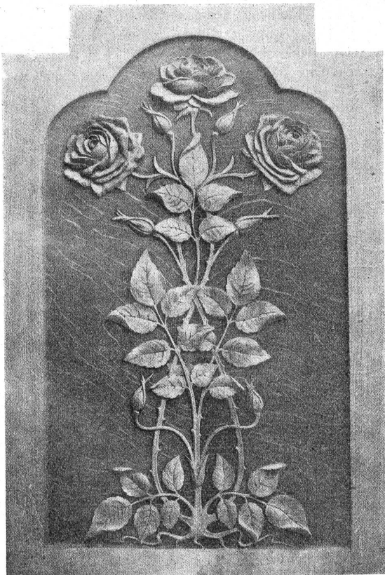
Entworfen von H. Kienholz, geschnitzt von Schülern.

dern immerfort zu neuen Studien nötigen. Angesichts dieser Arbeitslast möchte mancher nicht Schnitzerschul-Direktor sein.