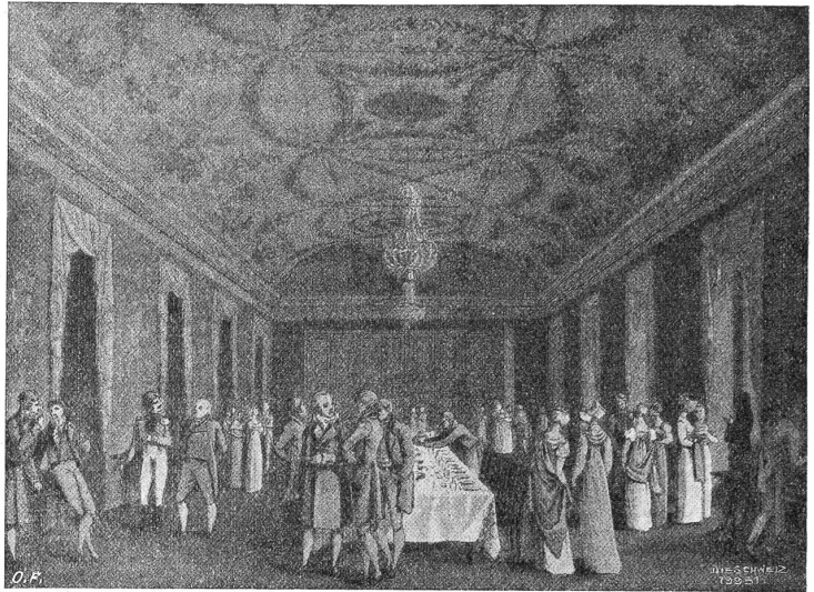
Speisesaal im Schinznacherbad (1814). Nach Kupfergravuren von Franz Hegi.

Was feinerzeit dem edlen Balthasar vorschwebte, ein neues Geschlecht heranzuziehen, das durch Sittenerneuerung