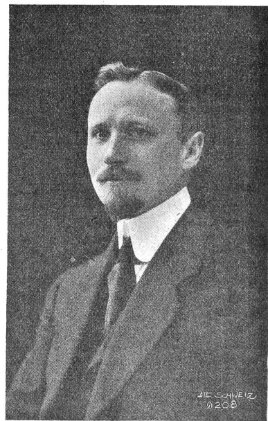
Marc Peter, der neugewählte Schweizer-Minister in Amerika.

Das eidgenössische Politische Departement teilt der Presse mit, daß die Mission nach London, mit welcher der Bun-