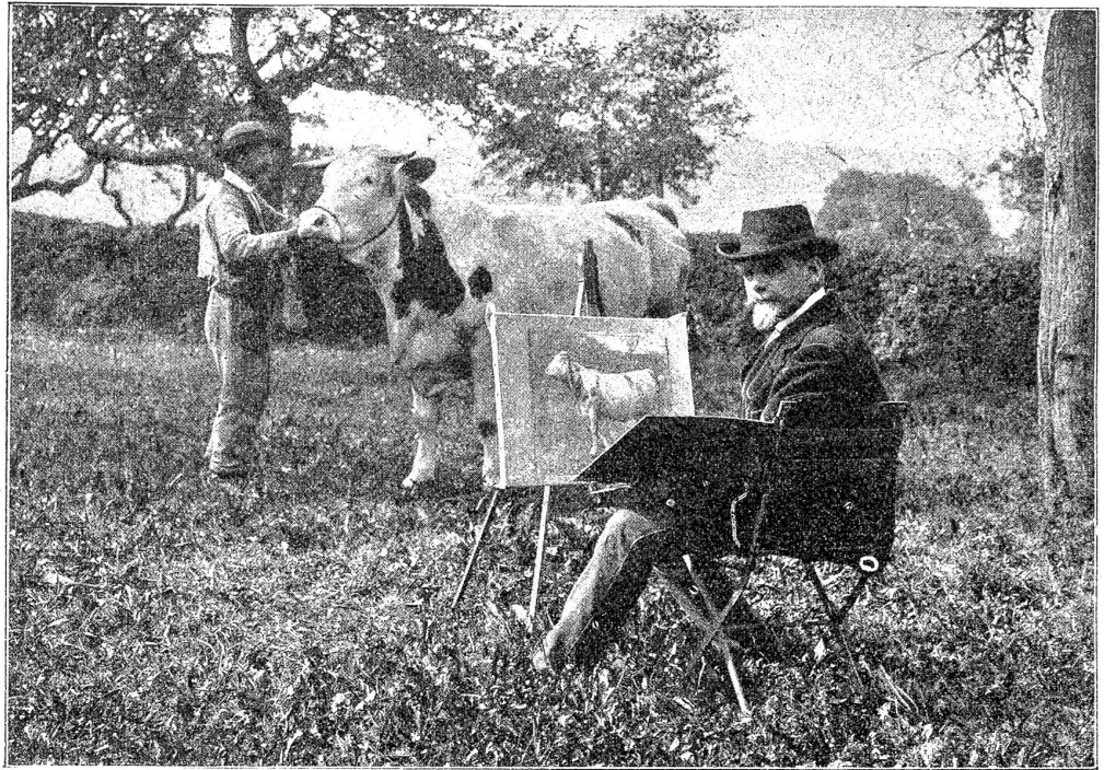
† Eugén Burnand auf seinem Landhause in Sépey bei Moudon. (Aufnahme aus dem Jahr 1911.)

Aber traurig stand ich am Morgen auf und nahm den Vorwurf Sebulons schwer und unverstanden in den Tag hinein.