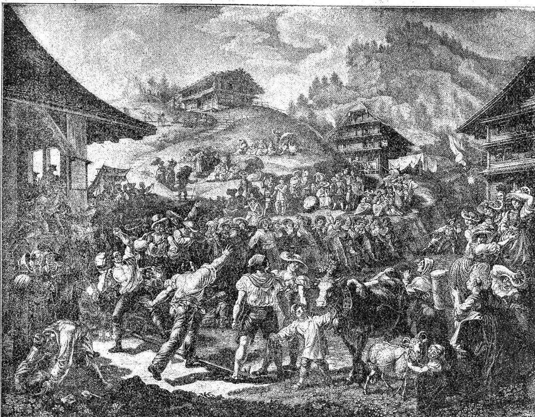
Ludwig Vogel (1788—1879). Steinstossen auf Rigi-Klosterli am St. Magdalentag. Nach dem Ölgemälde von 1823.