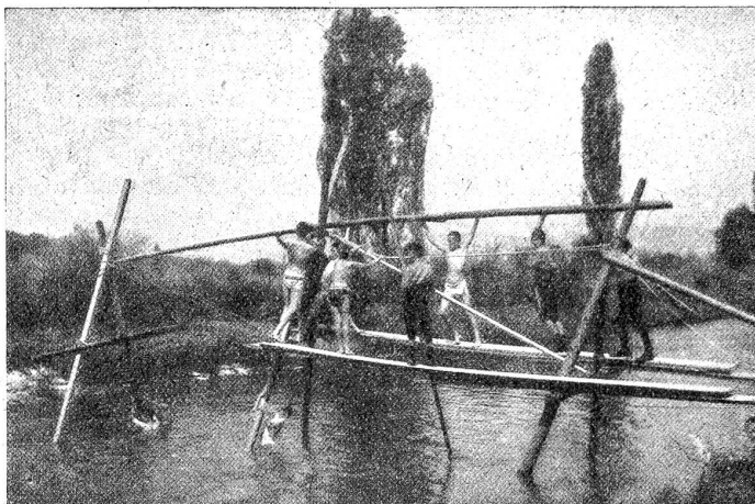
Pfadfinder beim Brückenbau.

uns fand, was er sich versprach. Und wiederum: Nicht alle Führer und Pfadfinder sind das geworden oder werden noch, was die Pfadfinderei aus ihnen hätte machen sollen: „Brauchbare, aufrechte, tüchtige Männer! Auch mit