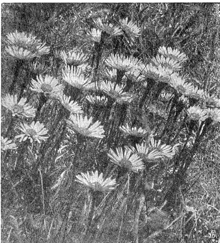
Alpenasterngruppe von Murter (Val Cluozza, Nationalpark).

zur Abfertigung; wenn es noch Wichtiges gewesen wäre! aber immer wieder hätte es gekautet: Alpenblumen, Alpenblumen. Es nehme ihn nur wunder, daß es noch Alpenblumen gebe in der Umgebung. Ein gutes Geschäft lasse