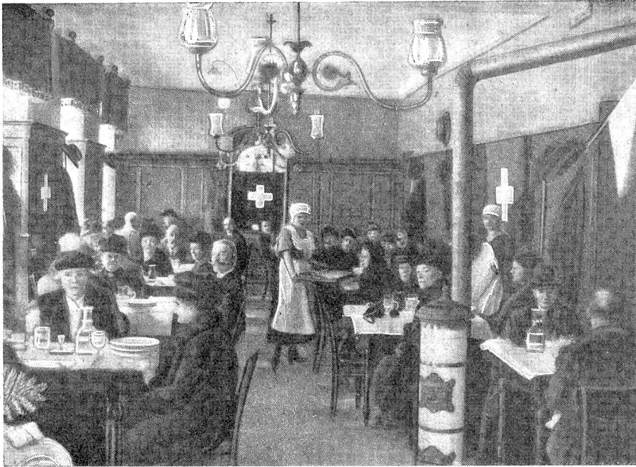
Die Schweizerküche an der Laudongasse in Wien.

liere er seine Pension; auch unsere neugierige Frage beantwortete er uns freimütig: „300 Kronen monatlich. Das ist ja wenig, aber dem Staat schenken wir nichts.“ Er und seine Schwiegereltern essen in der Gemeinschaftsküche. — Herr und Frau Oberst von J., die uns zum Nachmittags-tee geladen, behelfen sich auf gleiche Weise. „Wenn man sich die Stiefel selber reinigen muß, was kann man besseres tun?“ Ehedem führten sie ein Haus mit Dienerschaft. Die kleine Frau Oberst hat trotz allem den Humor nicht verloren. Ihr Tee war splendid. Wenn auch die Kidel fehlte, so war doch das Silberkärtchen dafür da. Lachend zählte mir die Gastgeberin auf, was jetzt alles fehlt in ihrem Haushalt: Raben, Hund; ich erinnere mich in der Tat nicht, in den zehn Tagen meines Wiener Aufenthaltes ein einziges dieser Geschöpfe gesehen zu haben.