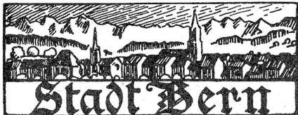
† Wilhelm Roos,

Das Personal der Berner Oberland-Bahnen und mitbetriebenen Linien hat die Intervention des Regierungsrates im Lohnkonflikt mit der Verwaltung dieser Bahnen abgelehnt und ist am Donnerstag früh in den Streik getreten.