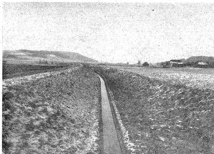
Neuer Hauptkanal von Moospinten-Brücke aus. Rechts die Moos-häuser.

Wir machen einen Gang durch das alte Bauernhaus und sehen uns zunächst in der Wohnstube, in der Hinterstube und in den Nebenküchlein etwas um. In der Stube fallen uns die großen zweischläfigen Betten auf, wo in einer hohen, hölzernen Bettstatt ein tiefer Strohsack mit Federunterbett darüber, mit selbstgesponnenen und selbstgewobenen, zwar etwas groben Leintüchern belegt ist und das massige Federdeckbett und die Hauptkissen mit blau und rot gestreiftem oder gewürfeltem Költch angezogen sind. Vom runden oder ovalen Betthimmelgestell hängen die farbig gemusterten Bettvorhänge faltenreich herab, hinter welchen sich der arbeitsmüde, franke oder altersschwache Erdenbürger, ungestört vom Kinderlärm und den lästigen Fliegen, zurückziehen und zur Ruhe legen konnte. Wir finden neben dem Bett im Winter beim warmen Ofen, im Sommer beim offenen, sonnigen Fenster den geschützten, gut gepolsterten, mit Rücken- und Armlehnen versehenen Lehn- oder Krankenstuhl. Beim Öffnen des zweitürigen Schrankes in der Zwischenwand entdecken wir die sommerlichen Zwischkleider und die für den Winter bestimmten Halbkleider, alle aus selbstgesponnenem Zeug verfertigt, und die wohl versorgten