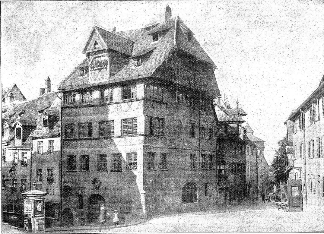
Das Dürerhaus in Nürnberg, in dem Albrecht Dürer am 21. Mai 1471 geboren wurde.

hatte der Mann sein ganzes Vermögen in den eingetretenen Revolutions- und Kriegsjahren wieder verloren, so daß er, statt das Haus zu beziehen, wieder fortgezogen war, um dort, wo er die früheren Glücksgüter gefunden, nachzusehen, ob nicht solche von neuem zu erhaschen wären. Das Haus aber war seither von Hand zu Hand gegangen in der Art, daß immer derjenige Seldwylser, der am meisten Lust und Mittel zu einem herrschaftlichen Dasein verspürte, dasselbe übernahm und eine Zeitlang bewohnte, ohne daß es jedoch im Innern jemals ganz fertig wurde.