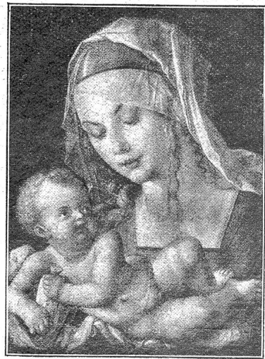
Madonna. Von Albrecht Dürer.

Gegenstände sind so liebevoll und sachlich korrekt dargestellt, wie man sie von einem Interieur-Architekten nicht genauer verlangen könnte. Nicht minder aufschlußreich sind seine Landschafts- und Städtebilder; gewöhnlich sind sie als Hintergrund zu einer Madonna oder einem Heiligen gedacht. Das mittelalterliche Dorfbild, mit den breit herabhängenden Strohdächern, mit Dorfbrunnen, Teich, Zäune, Feldweg liegt vor uns im Blatt: „Die große Kanone“. Nürnbergs Mauern und Türme und spitzgieblige Bürgerhäuser hat er ungezählte Male gezeichnet, aber in freier Zusammenstellung des Typischen und in der Ausschaltung des Zufälligen. Wir