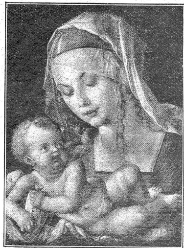
Madonna. Von Albrecht Dürer.

Gegenstände sind so liebevoll und sachlich korrekt dargestellt, wie man sie von einem Interieur-Architekten nicht genauer verlangen könnte. Nicht minder aufschlußreich sind seine Landschafts- und Städtebilder; gewöhnlich sind sie als Hintergrund zu einer Madonna oder einem Heiligen gedacht. Das mittelalterliche Dorfbild, mit den breit herabhängenden Strohdächern, mit Dorfbrunnen, Teich, Zäune, Feldweg liegt vor uns im Blatt: „Die große Kanone“. Nürnbergs Mauern und Türme und spitzgieblige Bürgerhäuser hat er ungezählte Male gezeichnet, aber in freier Zusammenstellung des Typischen und in der Ausschaltung des Zufälligen. Wir