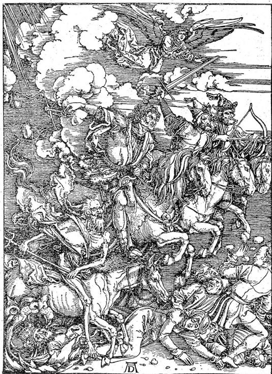
Die apokalyptischen Reiter. Zeichnung von Albrecht Dürer.

lungen über Musik und Gymnastik, wie er eine Proportionslehre geschrieben hat, so verfaßte er auch eine Schrift über