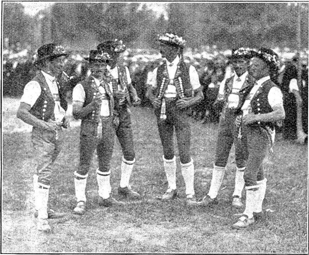
Vom Eidg. Schwing- und Aelplerfest in Bern: Jodlergruppe Urnäsch (Appenzell).

Dann begann die Zeit, in welcher sich auch die Stadter um das Schwingen zu interessieren begannen. Da stiegen