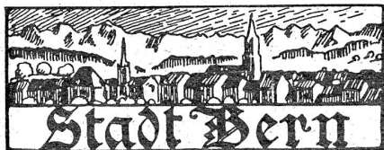
† Christian Strahm.

Der Geschäftsbericht der Bern-Lötschberg-Simplon-Bahn berichtet von keinen wesentlichen Erfolgen auf finanziellen Gebieten, wohl aber von Hoffnungen auf die Zukunft. Die Bahn hat die Erfahrung vieler anderer Betriebe teilen müssen, daß mit der Einstellung der Feindseligkeiten im Weltkrieg die Krisis noch lange nicht zu Ende ist. Immerhin weiß der Bericht von einer Zunahme im Gepäck- und Gütertransport zu berichten, auch der Transitgüterverkehr nahm zu. 1920 stieg die Reisendenzahl von 1,725,304 im Vorjahre auf 1,950,079, der Gepäcktransport von 5351 auf 6136 Tonnen. Im Güterverkehr zeigt sich gegenüber 1919 eine Zunahme von 364,486 Tonnen (1919: 285,365 Tonnen; 1920: 1,622,851 Tonnen). Im Berichtsjahre hatte die Bahngesellschaft nicht weniger als für Fr. 1,964,846.71 Reparatur- und Neubauposten. Aus diesen wenigen Angaben ist genügend ersichtlich, daß die Bahn den Titel „Sorgenkind der Berner“ immer noch nicht ablegen kann.