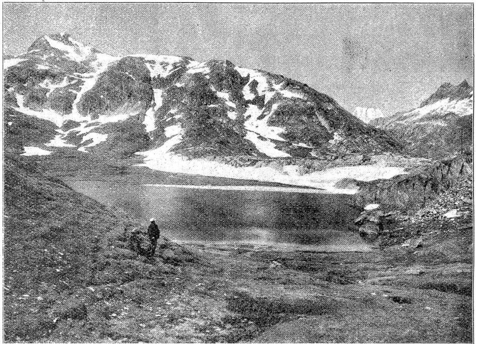
Der Grimselsee. Da die Aare hier durch einen Staudamm über 90 m hoch gestaut werden soll, werden die Seelein im großen Stausee verschwinden, das Hospiz wird abgebrochen und mit der Grimselstraße verlegt werden.

Dazu kommt ein weiterer Kapitalbedarf der B. N. K. für ihre übrigen Anlagen im Betrage von Fr. 44,795,700, so daß sich ihr ganzer Kapitalbedarf während der achtjährigen Bauzeit der Oberhasliwerke auf Fr. 177,905,146 beläuft. Zur Deckung desselben wird folgendes Verfahren vorgeschlagen: a) Möglichst baldige Erhöhung des Aktienkapitals um 40,000,000 Franken; b) Nochmalige Erhöhung des Aktienkapitals nach etwa 4—5 Jahren; c) Beschaffung der über das Aktienkapital hinaus erforderlichen Geldmittel durch Bankendarlehen und Obligationenanleihen nach Maßgabe des Bedarfs und der allgemeinen Verhältnisse auf dem Geldmarkt. Den hohen Kosten steht ein Energiegewinn gegenüber von 379 Millionen Kilowatt jährlich, zu einem Gestehungs-