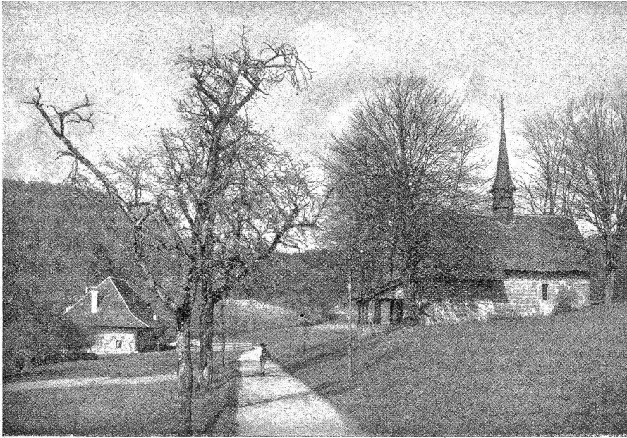
Die St. Bartholomäuskapelle und das alte Sickenhaus bei Burgdorf.