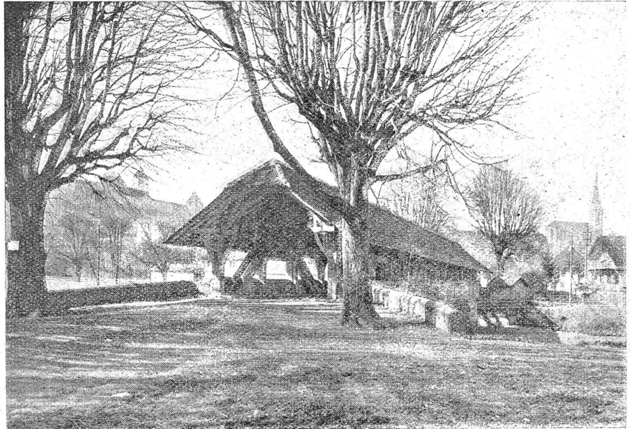
Die Wynigenbrücke bei Burgdorf.

breitete sich von hier aus nach und nach auch über die anderen Länder. Da man die Krankheit nicht zu behandeln verstand, sie aber sehr erblich war, half man sich durch die Erbauung von Siechenhäusern. Das Kloster St. Gallen muß schon im 8. Jahrhundert ein Siechenhaus besessen haben. Nach einer Verordnung der Äbtissin am Fraumünster in Zürich bestand das Siechenhaus zu St. Jakob an der Sihl im Jahre 1291. In Basel siedelten die Sonderjischen im Jahre 1286 vom St. Leonhardsberge an ihre neue Behausung zu St. Jakob an der Birs. In Solothurn bestand im 14. Jahrhundert ein Siechenhaus mit einer kleinen Kapelle. Bern erbaute zu Anfang des 13. Jahrhunderts ein Siechenhaus, das anlässlich der Belagerung der Stadt durch Rudolf von Habsburg im Jahre 1288 verbrannte, bald aber wieder aufgebaut wurde und zwar beim Obstberge in der Gemeinde Muri. Es wurde auch mit einer kleinen Kapelle versehen. Dieses Siechenhaus wurde 1601 mit dem Blatternhaus vereinigt. Man scheute die Siechen sehr. Das beweist eine Verordnung der Berner Regierung vom Jahre 1493: „Die Sonderjischen sollen nicht mehr in die Stadt kommen, um zu betteln, sondern man soll alle Wochen einen gefunden Mann auf einem Rößlein mit einer Schelle in die Stadt schicken, um Almosen einzusammeln“. Anderwärts mußten die Siechen einen besondern Mantel tragen, daß sie allen Leuten kenntlich waren, auf daß man ihnen aus dem Wege gehen könne. Auf jeden Fall hatten die „Sonderjischen“ und Leprosen ein trauriges Leben.