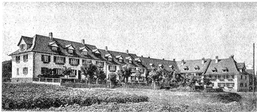
Wohnkolonie der Fabrik Maggi, Kemptal.

Frauenbewegung in der Schweiz sich als Ziel ihrer Arbeit denken. Ihre Rede bewies, daß sie die Idee der Frauenbefreiung reiflich erwogen und durchdacht hat. Sie kennt aber auch die Hemmungen und die Schranken der Bewegung und weiß, daß sie als Hüterin der ihr immanenten religiösen Grundidee hinweisen muß auf das „Eine was not tut“ und daß sie warnen muß vor falschen Wegen.