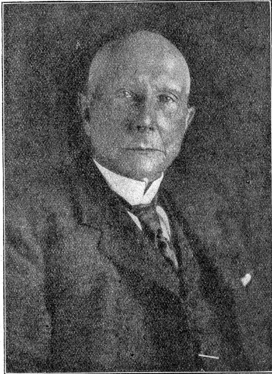
Der amerikanische Petroleumkönig John Davison Rockefeller.

Und das Anneli ging. Es setzte sich auf die Bank zum Wackerbold. Es sagte seine Sätzlein her, aber es ward