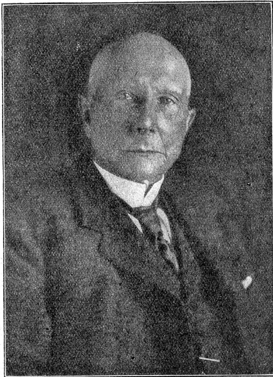
Der amerikanische Petroleumkönig John Davison Rockefeller.