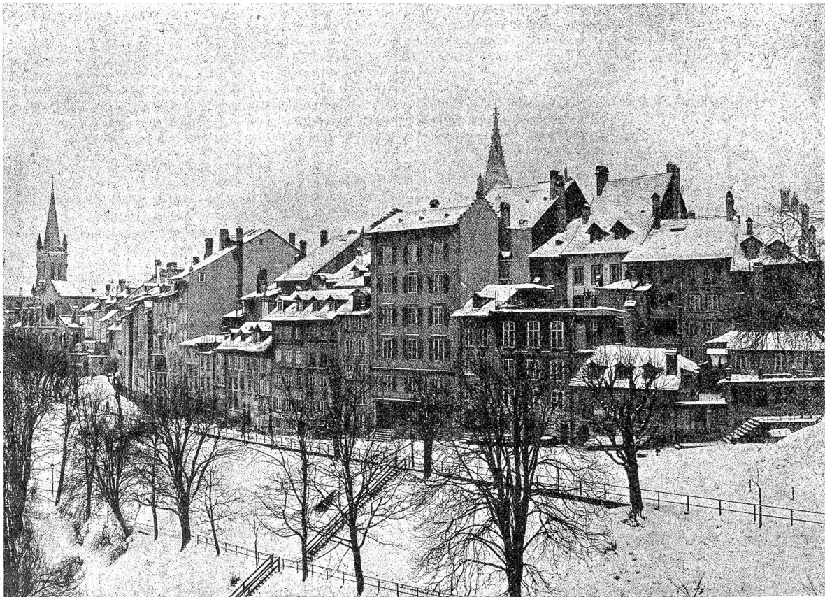
Die alte Entbindungsanstalt an der Brunngasse.

Im Jahr 1598 isch die sogenannte „Mädchelehr“ mit d'r „Lehrgotte“ a d'Brunggass zoge, wo snerznt d'Eländeherbärg mag gschände ha und isch du im Jahr 1664 i d's Huus undehär usoge, wo späater d'Realschuel isch baut worde.