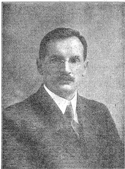
Dr. Emil Klöti