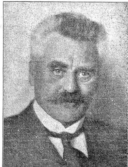
Dr. Käber

Eine Arbeitsinitiative soll demnächst lanziert werden, die in die Bundesversammlung den Grundsatz aufnehmen will, daß Bund und Kantone die notwendigen Maßnahmen zum Schutze der Freiheit der Arbeit und der Arbeitswilligen ergreifen. Ferner soll der Gewerbegehalt der Bundesverfassung so eingeschränkt werden, daß für die Landwirtschaft, die Hauswirtschaft und das kleine Gewerbe eine gesetzliche Regelung der Arbeitszeit nur insoweit zulässig sei, als es sich um Sonntagsheiligung, Nachtruhe, Kinder- und Frauenschutz und Heimindustrie handelt. Als Arbeitszeitgrenze ist die Normalwoche von 54 Stunden, resp. 50 Stunden vorgesehen. —