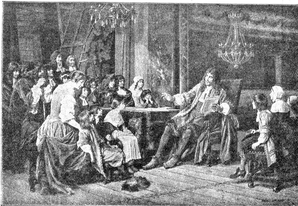
Molière und seine Truppe.

der Universität zu Orleans auch eine ordentliche geistige Ausbildung genossen hatte. Aber schon den 17-Jährigen verlockte der Teaterteufel in der Person der schönen Madelaine Béjart. Mit ihr und einigen andern Schauspielern gründete er, der väterlichen Zucht und Lehre entlaufen, das „Mustré Theater“, das aber schnell genug verfrachtete. Die bei diesem Unternehmen gemachten Schulden büßte er im Schuldenturm ab. Aber seine Begeisterung für die Muse Thalia ward dadurch nicht vermindert. Er schloß sich sofort wieder einer Schauspielertruppe an und durchzog mit ihr Frankreich, von Hauptort zu Hauptort, wo die Tagungen der Generalstände jeweilen mit Schauspielaufführungen vergnüglich beendigt wurden. Auf diesen Wanderungen lernte Molière das Leben kennen und errang dabei den scharfen