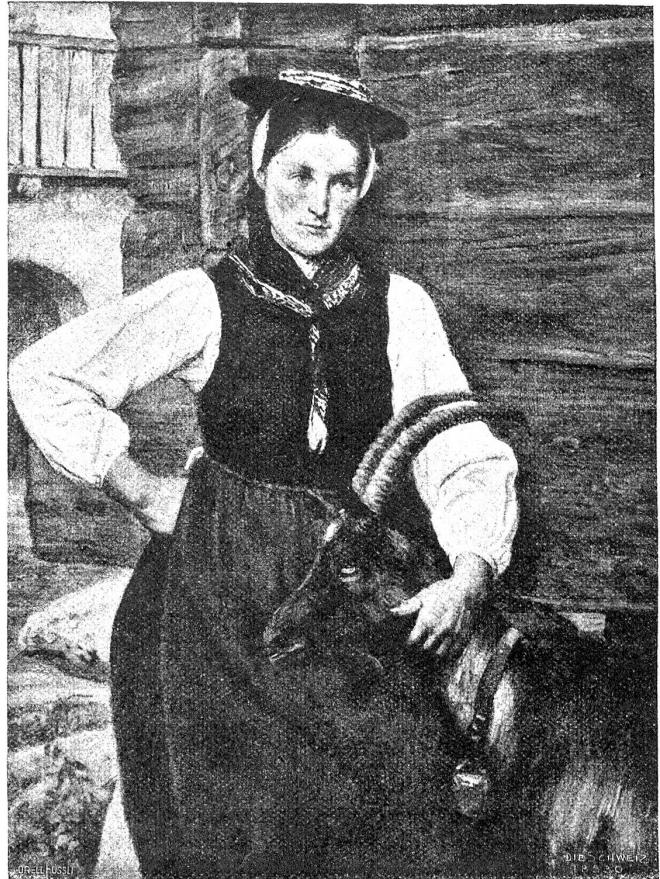
Henry van Muyden : Mädchen mit Geiss.

„Liebe Mama,“ sagte sie leise und weich, „wenn ich sage: das liebe, alte Haus, ist denn das etwas anderes als du und der Vater selig? Wer hat die Rosen gepflanzt im Garten, die ich so gern habe? Du! Wenn ich sie liebe, liebe ich nicht dich? Wer hat das ganze Haus im Stande gehalten? Du! Wer hat den Kasten in den Gang gestellt? Du! Und wenn er mir so viel wert ist, bist du nicht in