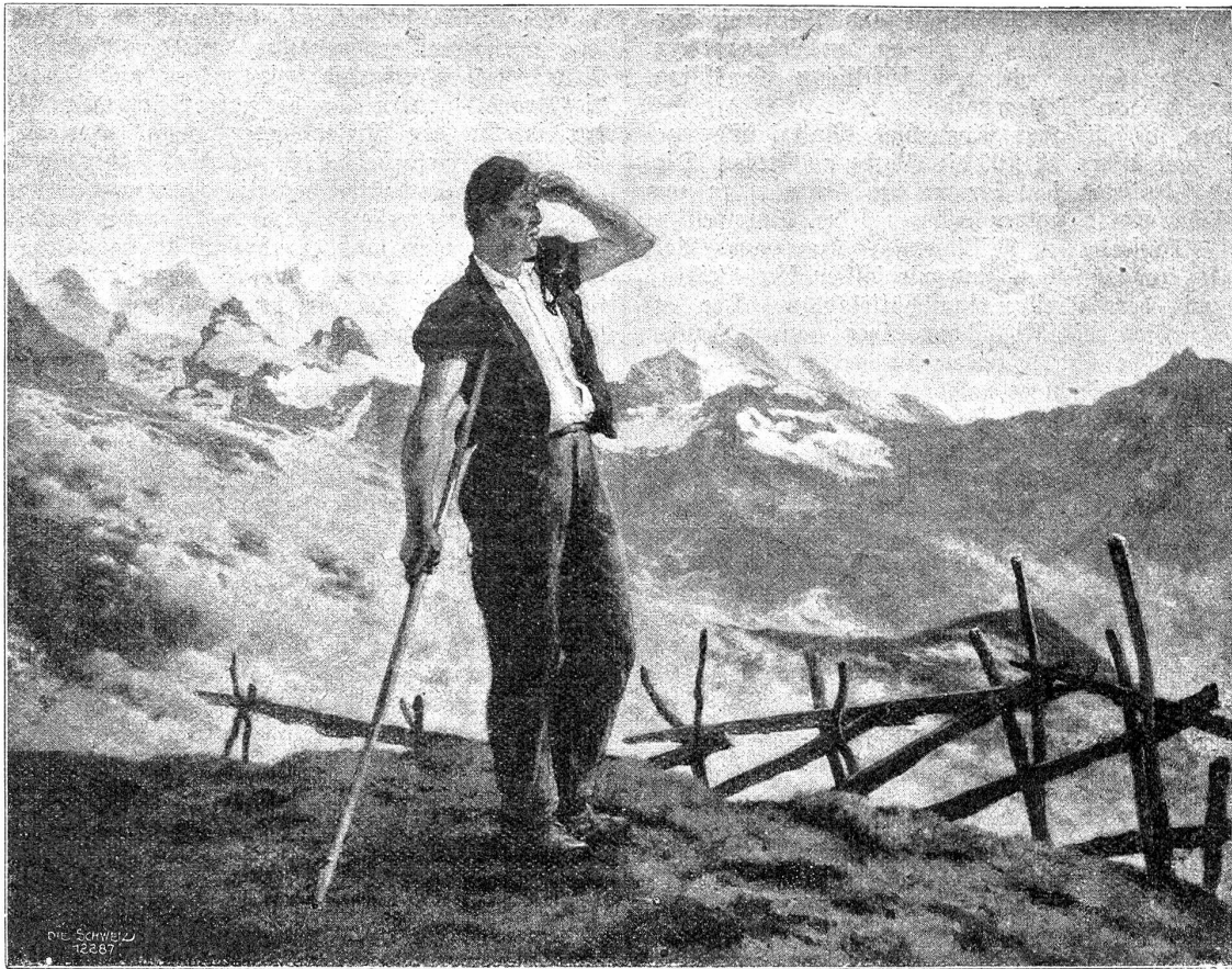
Helpler, Ausschau haltend. — (Nach einem Gemälde von Baud-Bovy.)

Brand in den Ruinen und im Balkenwerk zusammengefallener Staaten wütet und daß unter der Schutt- und Aschendecke die Explosionen der Revolutionen drohen. Und immer noch häufen sich die Schutt- und Trümmernmassen, noch ist die Periode der Zusammenbrüche nicht vorüber; Oesterreich wird den Weg Rußlands gehen, wenn ihm nicht raschestens Hilfe gebracht wird, und Deutschland scheint weder die wirtschaftlichen noch die moralischen Kräfte zum Tragen der Friedenslasten zu besitzen; auch dieses Land gleitet auf der schiefen Bahn der Geldentwertung immer schneller dem Bankrott zu. Wahrlich, die Zukunft liegt düster vor uns und das fünfte Friedensjahr, das sich anschließt, durch das Zeitentor einzuziehen, schickt keine rosenfarbenen Wölklein der hoffenden Zuversicht voraus.