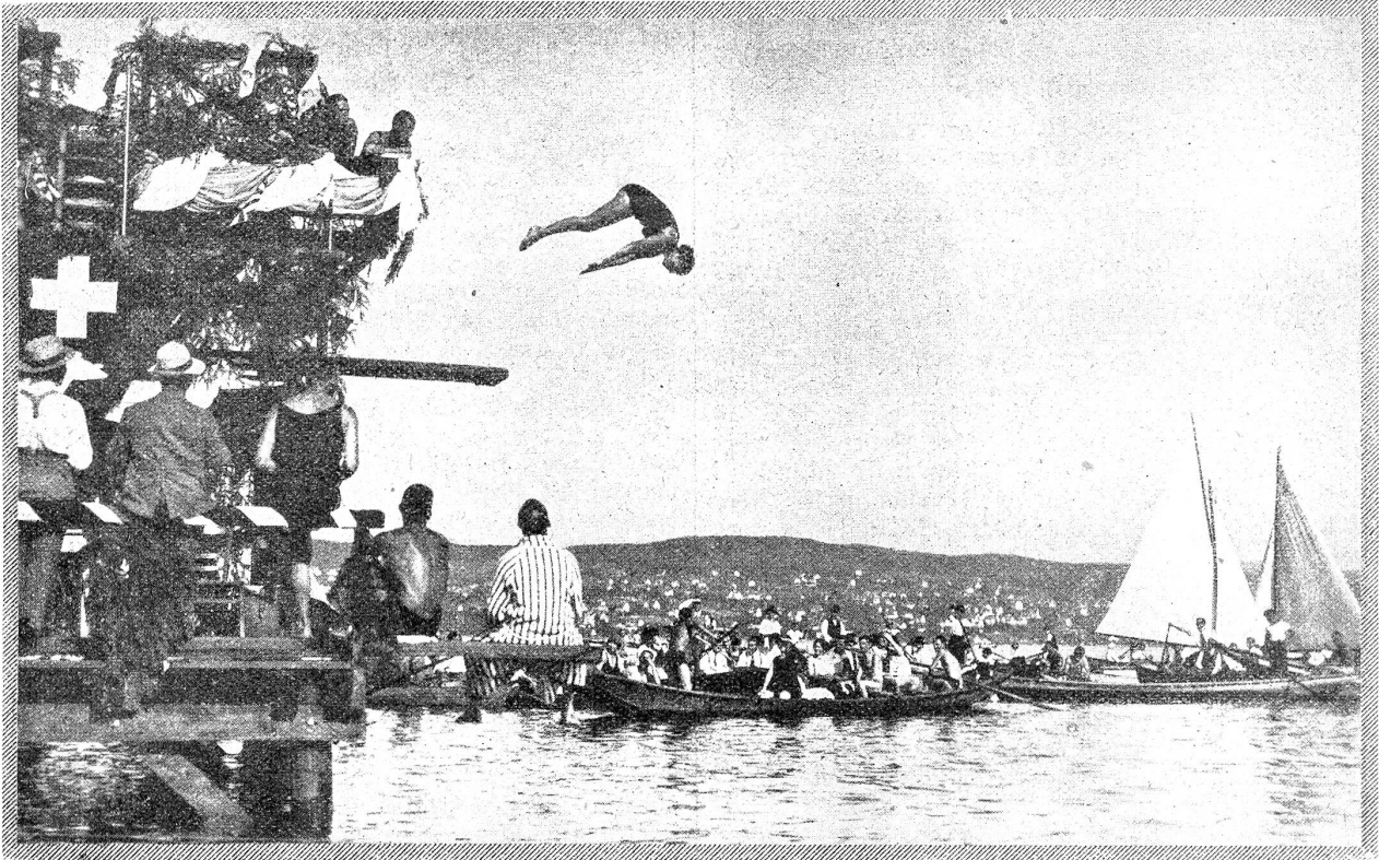
Von den schweizerischen Schwimm- und Wasserballmeisterschaften in Zürich.