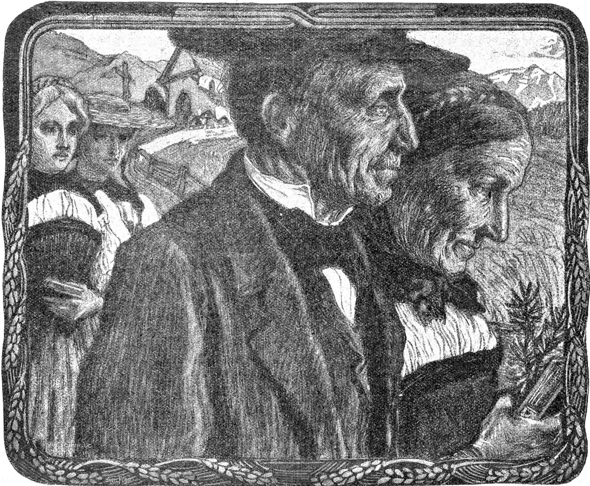
Bürkh. Mangold : Heimkehr von der Kirche

Unten in der rauchigen Stube, deren schwere Deckbalken bald wieder unterm Takttritt der Tanzenden zu zittern und zu ächzen begannen, gesellte sich nach einer Weile mein Gëtti Kramer zu mir. Das sei von mir ein verständiger Zug, daß ich auf einen alten Mann abstelle, lobte er. So viel wie die Mättliochter kriege jedes Hudelmädchen mit. Aber er habe bald geglaubt, ich würde vom Regen in die Traufe kommen. Mit unserer Tanzbale sei allweg nicht viel mehr los, als daß sie irgendwie einen Reif abgesprengt habe und nun auswärts einen Mann aufgabeln müsse, weil's ihr daheim nicht ziehe und keiner die faule Trude verhalten wolle. Ich hörte seinem Geschwäh nicht lange zu, ich trank bald aus und ging stillschweigend meiner Wege.