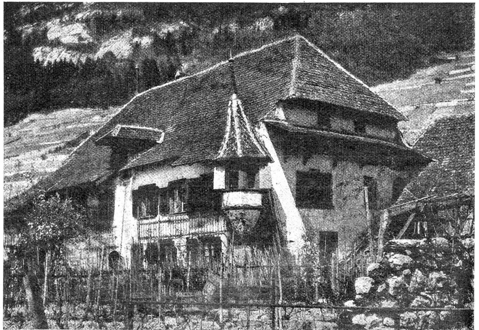
Ligerz am Bielersee. „Der Hof“. (Vergl. den Aufsatz S. 545.) Ehemaliger Sitz der Junker von Ligerz 1545.

Einst als Anna wie jeden Tag zum Kranken kam, zu fragen, wie sie geschlafen und die grobe Arbeit zu tun, fand sie Mutter und Sohn schlafend. Eine tiefe Freude erfüllte sie ob der Ruhe. Josefs verklärtes, stilles Lächeln bannte sie an die Schwelle und eine geheimnisvolle Scheu, die Scheu vor etwas Heiligem, wehrte ihr, näher zu treten. Josefs blasser Lippen waren leicht geöffnet und aus der Deffnung schaute ein Geheimnis: Kannst du's erraten? Aber der Schlaf der Mutter war noch tröstlicher. Sie sah, wie an der welken Haut der Schläfe die blauen Naderchen sich kreuzten und um das tiefe Auge die Runzeln ein enges Netz gesponnen hatten, sie schrumpft zusammen, könnte sie