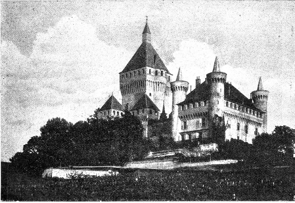
Schloss Vullens am Genfer See. (Vergl. den Aufsatz S. 545.) Anfang 16. Jahrhundert. Anlage älter. (Druckstock aus „Die alte Schweiz“.)