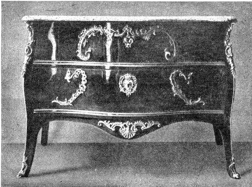
Bern. Zunft zu Mittellöwen.

Sog. Sunk-Kommode mit Platte aus Grindelwaldner Marmor. Mitte 18. Jahrhundert. (Druckstock aus „Die alte Schweiz“)