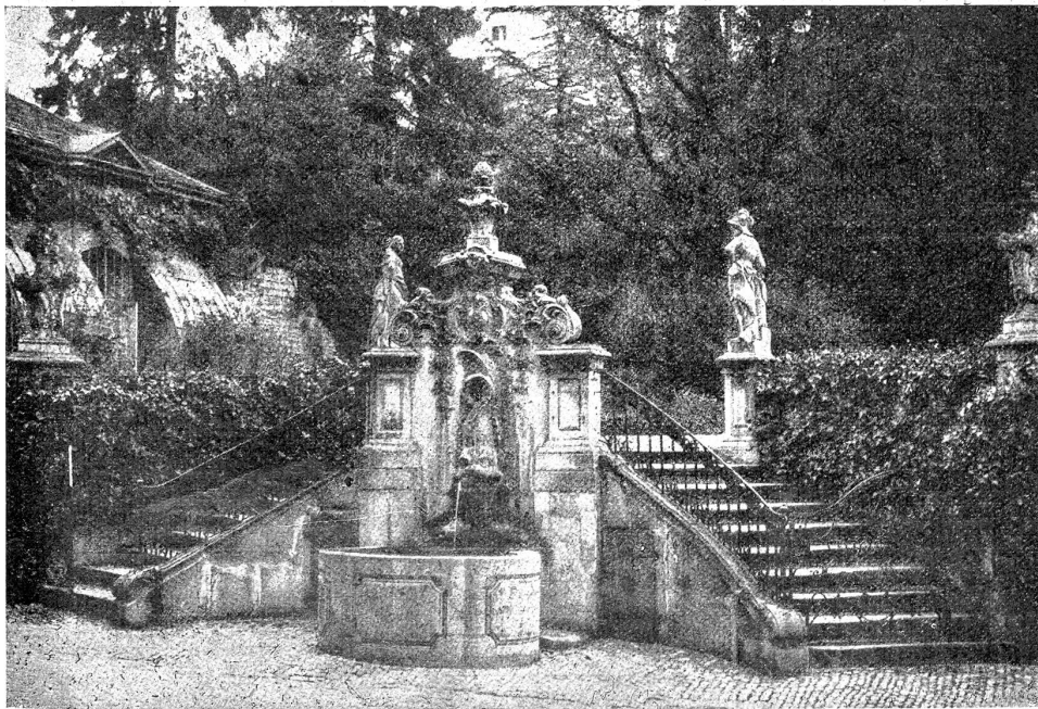
Zürich. Im Garten des Hauses „zum Reehberg“. Um 1770.