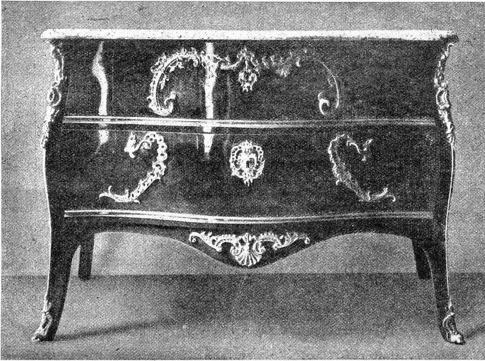
Bern. Zunft zu Mittellöwen.

Sog. Sunk-Kommode mit Platte aus Grindelwaldner Marmor. Mitte 18. Jahrhundert. (Druckstock aus „Die alte Schweiz“)