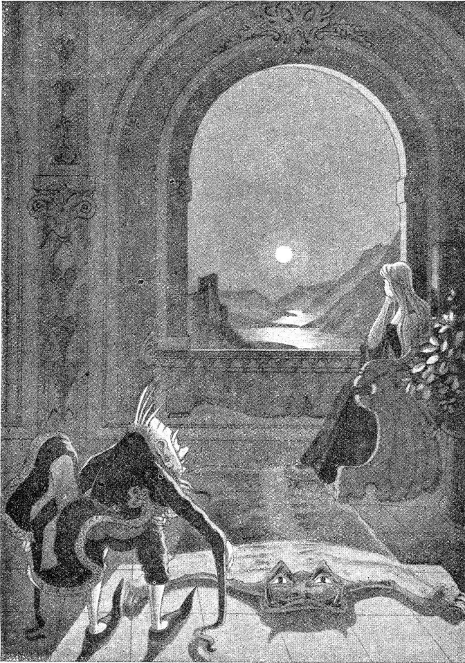
Aus dem Engadin. Märchen und Schwänke erzählt von Gian Baudi. Bilder von Hans Eggimann. (Verlag A. Srancke, Bern.)

das ihn verzehrte, brannte. Es war etwas in diesem Blick, was nicht nur von körperlicher Krankheit zeugte, sondern eine seelische Qual verriet, die heißer als das Fieber war.