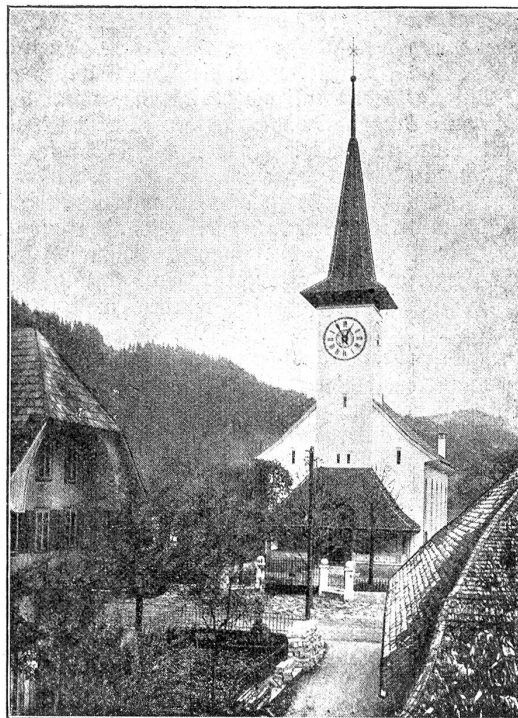
Kirche in Trubschachen nach dem Umbau. Ruhiger, würdiger Bau, wie er Trubschachen wohl ansteht. Architekten Minder und Baur, Bern. (Nach Photographie von R. Deyhle & Cie., Bern.)

sind, da sie dem Wetter die denkbar günstigsten Angriffspunkte bieten. Die stark vorgeschrittene Verwitterung dieser „Schmuckteile“ gab denn auch in Trubschachen den Anstoß