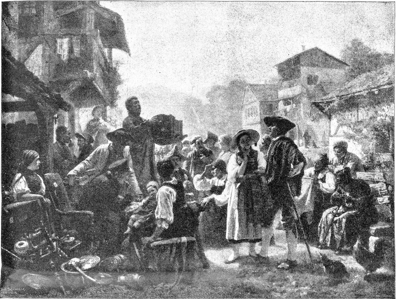
Marc Louis Benjamin Vautier 1829—1898: Die Versteigerung. Im Besitz der Gottfried Keller-Stiftung, deponiert im Musée Arland, Lausanne.