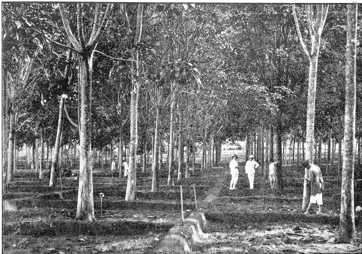
Gummikultur auf Sumatra. Zapfbare Gummibäume, 12 Jahre alt. Zwei Schweizer als Assistenten.

den. Pfähle kann man den Gummibäumen nicht beigegeben, wegen der drohenden Fäulnis.