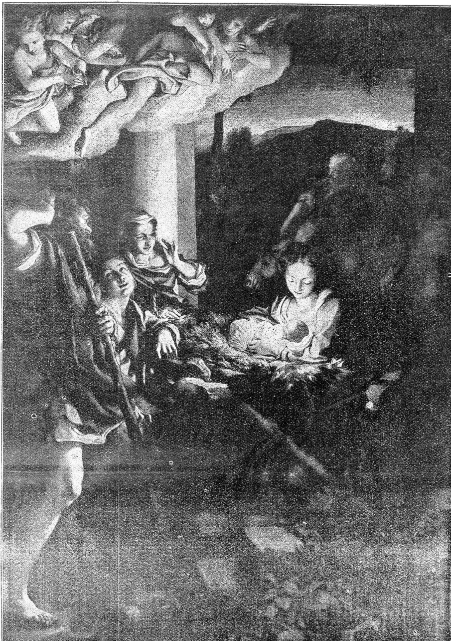
Correggio: Die Geburt Christi, genannt „Die Nacht“.

Während des Lesens überzieht ihr Gesicht eine tiefe Enttäuschung. Erblichend lehnt sie sich weit zurück auf den